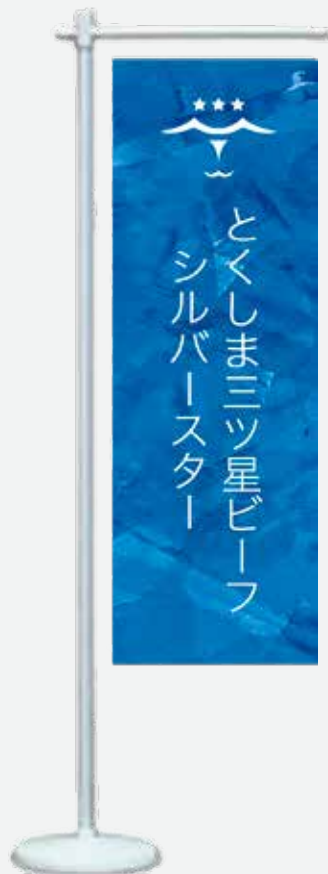
卓上ミニのぼり 10 × 30cm