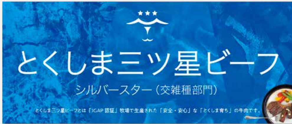
パネル 60 × 25cm