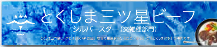
棚帯 30 × 6cm