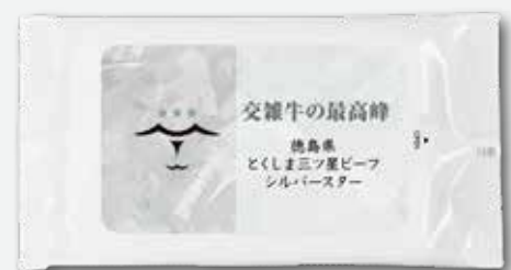
ウェットティッシュ